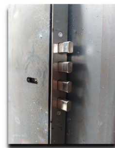
CERRADURA PASANTE DE DOBLE ENTRADA