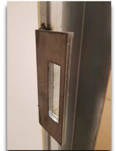
PUNTO DE ANCLAJE FRONTAL REFORZADO